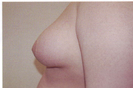
Fot. 3. Mieszana postać ginekomastii.

pełną radykalność zabiegu, dają dobre efekty estetyczne i pozostawiają niewidoczne blizny. Oczywiście, nie każdy pacjent kwalifikuje się do zabiegu małoinwazyjnego. Jedynie te osoby, u których elastyczność skóry pozwala rokować dobre jej obkurczenie, mogą skorzystać z dobrodziejstw tej metody. Najczęściej leczenie jest przeprowadzane w pełnym znieczuleniu (narkozie). Poprzez niewielkie nakłucie skóry długości 3 mm wprowadzana jest najpierw sonda do liposukcji, a następnie przyrząd zwany shaverem (fot. 4). Pozwala on na precyzyjne usunięcie poszczególnych fragmentów gruczołu piersiowego. Podobnie jak to ma miejsce u kobiet przy usuwaniu guzków piersi mammotomem, także tutaj zachodzi możliwość badania usuniętych tkanek pod kątem wykluczenia choroby nowotworowej. Zabieg wymaga dużej finezji ze strony chirurga. Końcówka shavera jest bowiem narzędziem niewybaczającym błędów. Właściwie kierowana przez sprawną rękę chirurga pozwala