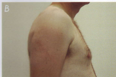
Fot. 6. Przykład ginekomastii mieszanej: A – przed, B – po operacji metodą shave.