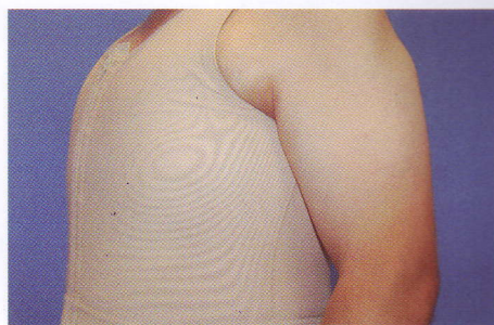
Fot. 5. Strój uciskowy jest stosowany przez 4 tygodnie po operacji ginekomastii.

pełną radykalność zabiegu, dają dobre efekty estetyczne i pozostawiają niewidoczne blizny. Oczywiście, nie każdy pacjent kwalifikuje się do zabiegu małoinwazyjnego. Jedynie te osoby, u których elastyczność skóry pozwala rokować dobre jej obkurczenie, mogą skorzystać z dobrodziejstw tej metody. Najczęściej leczenie jest przeprowadzane w pełnym znieczuleniu (narkozie). Poprzez niewielkie nakłucie skóry długości 3 mm wprowadzana jest najpierw sonda do liposukcji, a następnie przyrząd zwany shaverem (fot. 4). Pozwala on na precyzyjne usunięcie poszczególnych fragmentów gruczołu piersiowego. Podobnie jak to ma miejsce u kobiet przy usuwaniu guzków piersi mammotomem, także tutaj zachodzi możliwość badania usuniętych tkanek pod kątem wykluczenia choroby nowotworowej. Zabieg wymaga dużej finezji ze strony chirurga. Końcówka shavera jest bowiem narzędziem niewybaczającym błędów. Właściwie kierowana przez sprawną rękę chirurga pozwala