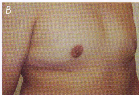
Fot. 7. Przykład ginekomastii mieszanej: A – przed, B – po operacji metodą shave.

żywności i właściwą aktywność ruchową. Wszystko to służy poprawie stanu zdrowia i kondycji mężczyzn. Jak wiemy, nie zawsze