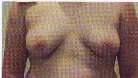
Fot. 1. Ginekomastia – wygląd piersi mężczyzny.

W ostatnich latach coraz częściej stosowane są techniki małoinwazyjne, takie jak liposukcja i metoda shave, które zachowując